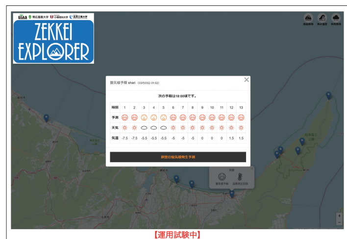
Zekkei Explorer https://diasjp.net/service/zekkei/

By applying this technology for collecting and analyzing observation data, “Zekkei Explorer” has potential for even more uses such as creating VR or AR of stunning scenery, photographing animals and plants, facilitating the use of information and communication technologies in agriculture. and enhancing fishing safety.