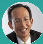
喜連川 優 情報・システム研究機構長 東京大学 特別教授